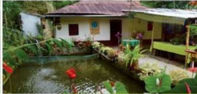
Casa principal Reserva Natural de la Sociedad Civil Entre Aguas, Baque (2011)